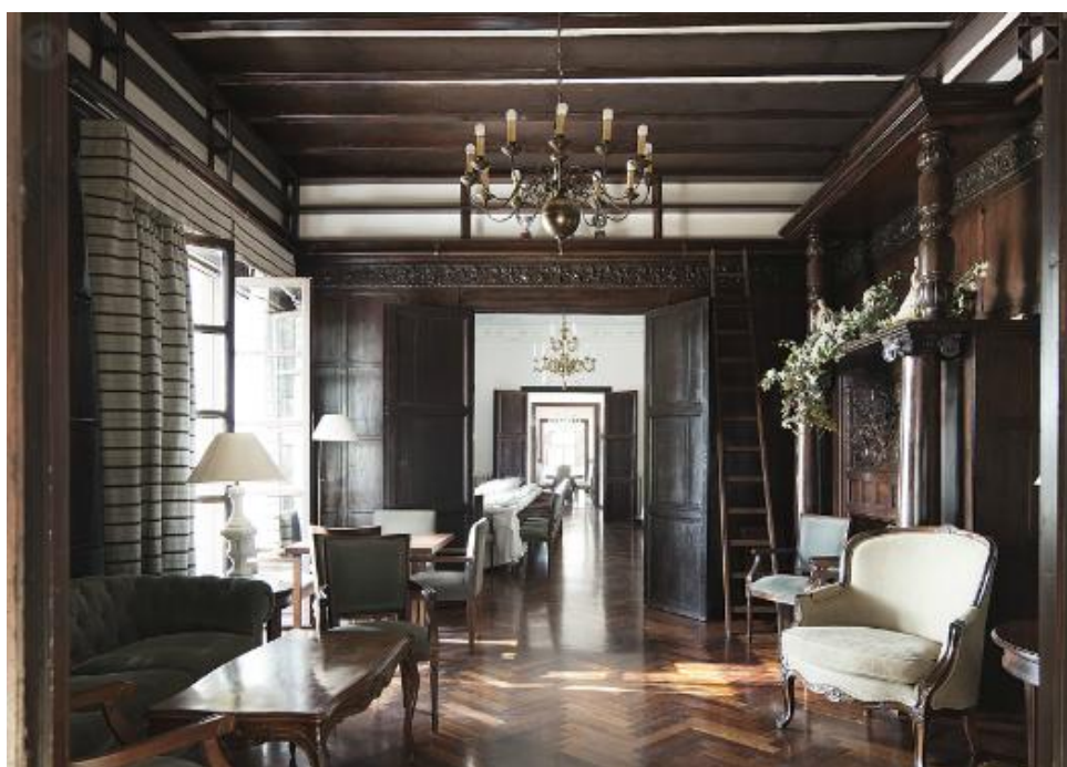
Dependencias de la planta principal

La extensa propiedad sufriría posteriormente una serie de segregaciones: Masía de la Jonquera , el Mas de Camarena , que hoy día