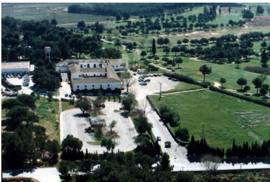
Vista área trasera de Massalconill