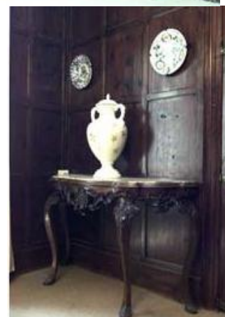
Algunas estancias de Massalconill.

La vida de los señores se circunscribía en la planta alta, a la que se llega por una amplia escalera de mármol. Se puede comprobar en su interior: los chapados de madera que visten sus paredes y sus magníficas chimeneas en cada una de sus salas, que se mantienen intactas en la decoración del Club Social. Grandes salones, amplias habitaciones, su sala de estar, la correspondiente biblioteca, el comedor, próximo a una sugestiva cocina justo encima de la despensa de víveres. Asimismo, es