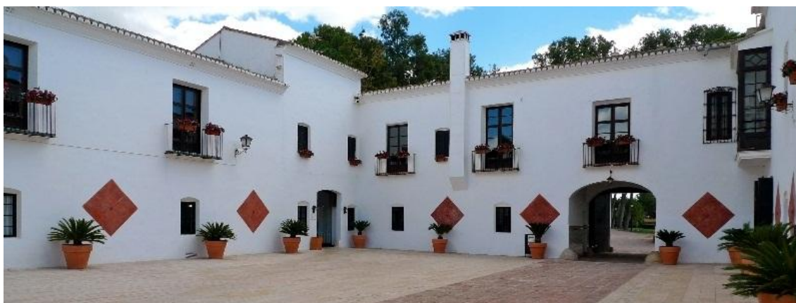
Patio central de la masía.