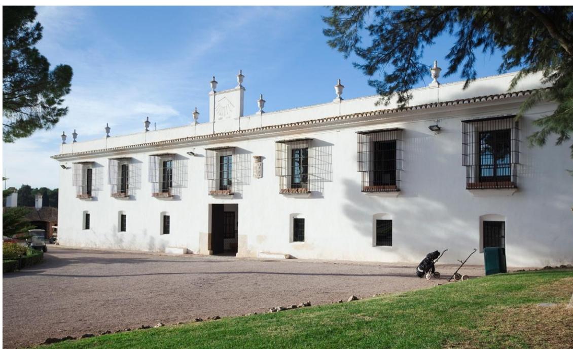
fot.: Club Escorpión]

La antigua finca y casona rural, situada a cuatro Km. de la capital del municipio, permaneció vinculada desde la Reconquista (siglo XIII) a los dueños del señorío de Bétera. En nuestros días es propiedad del Club de Golf “Escorpión” y cuenta con grado de Protección Parcial por su uso privado.