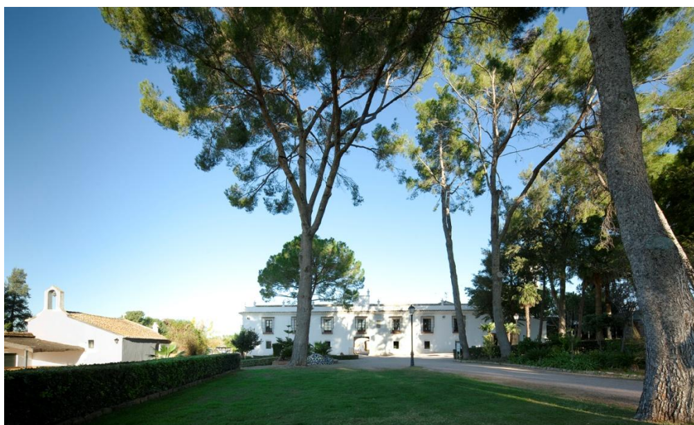
Masia y antigua ermita