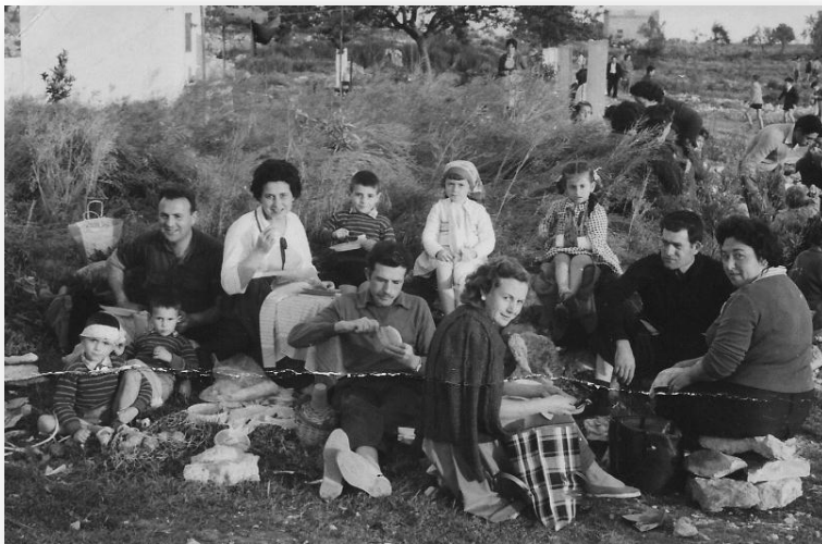
Un berenar de Pasqua en el Camí de Paterna (1961)

Estos dies de Pasqua són dies per jugar, volar el catxerulo i després a berenar