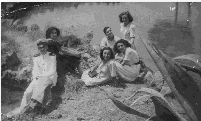
Colla d'amics en el Mas d'Aguirre (1949)

Els amos de la casa, en acabar, feien una espècie de pisolabis a base de carabassa o moniato torrats, acompanyats de copes de conyac o mistela, a més a més de pastes casolanes.