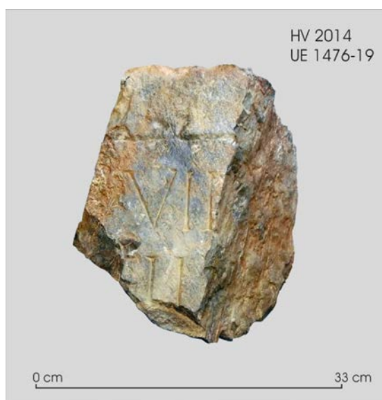
Fig. 2: Fragment núm. 1-a.