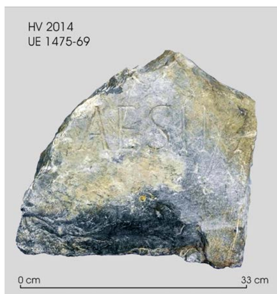
Fig. 3: Fragment núm. 1-b.