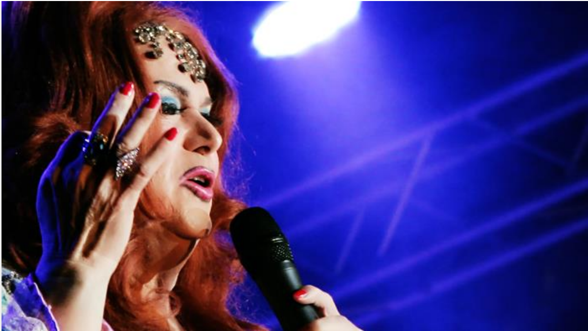
Fotograma de 'La Margot. Serio de día, coqueta de noche'.