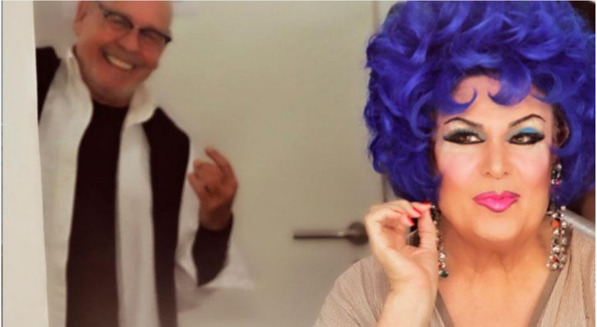
Fotograma de 'La Margot. Serio de día, coqueta de noche'.