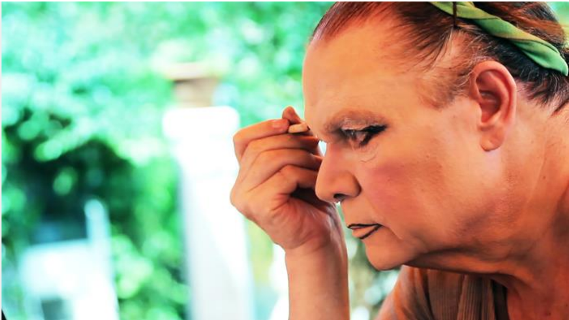
Fotograma de ‘La Margot. Serio de día, coqueta de noche’. Espai Rambleta.