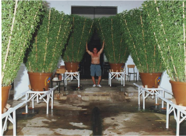
14 d'agost de 1994