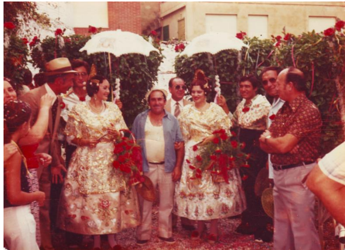
15 d'agost de 1976

El corral estava al carrer Marques de Dos Aigües i no tenia suficient espai cobert com per amagar les alfàbegues però, van tenir la sort de que en aquell any estava en construcció la coneguda com a finca del "barco" i, entre tots els que estaven en el corral i gent que hi havia pel carrer van traslladar les alfàbegues fins als baixos i pogueren salvar les alfàbegues d'una pedregada considerada com a històrica per la grandària